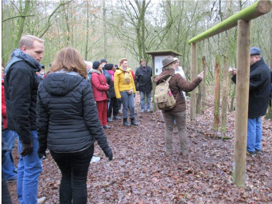
Station des Waldlehrpfads mit den einzeln verschiedenen Klanghölzern

Frau Kroll sprach auch einige Negativerscheinungen im Wald an, die zum Problem werden.